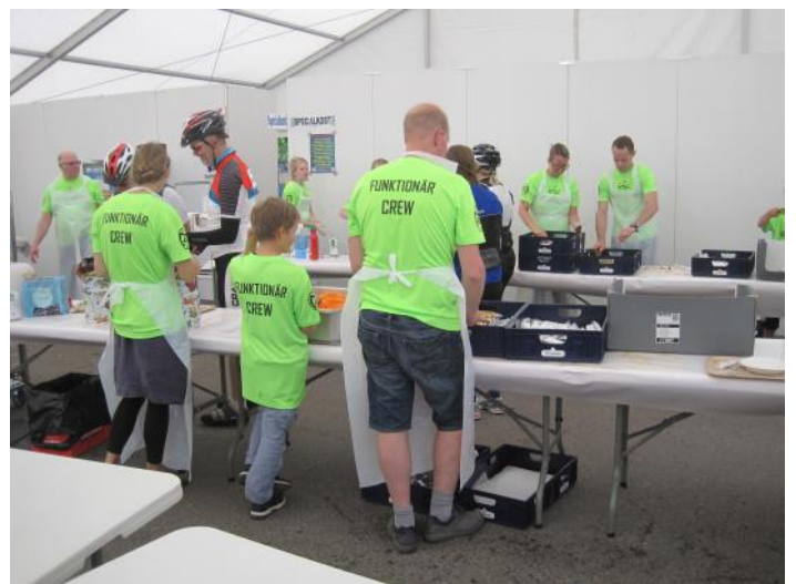
I år fick vi nya fräscha tröjor.