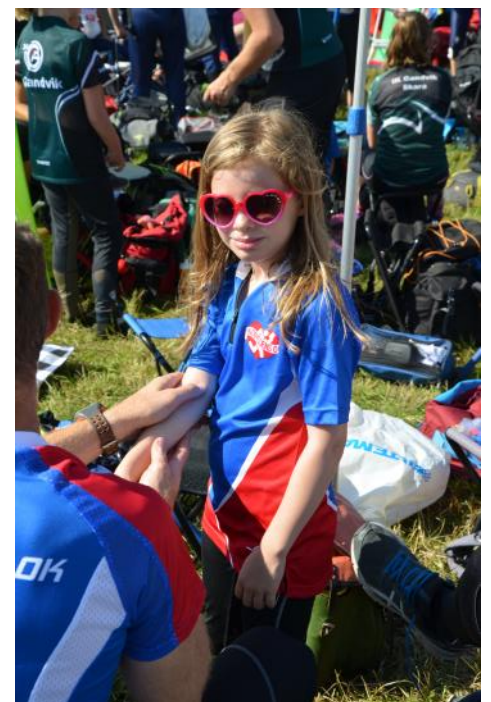
Bilder från O-Ringenveckan i Arvika från bland annat det sedvanliga långbordet med prisutdelning samt på några av de Hjobyggdare som sprang på O-Ringens fem etapper.