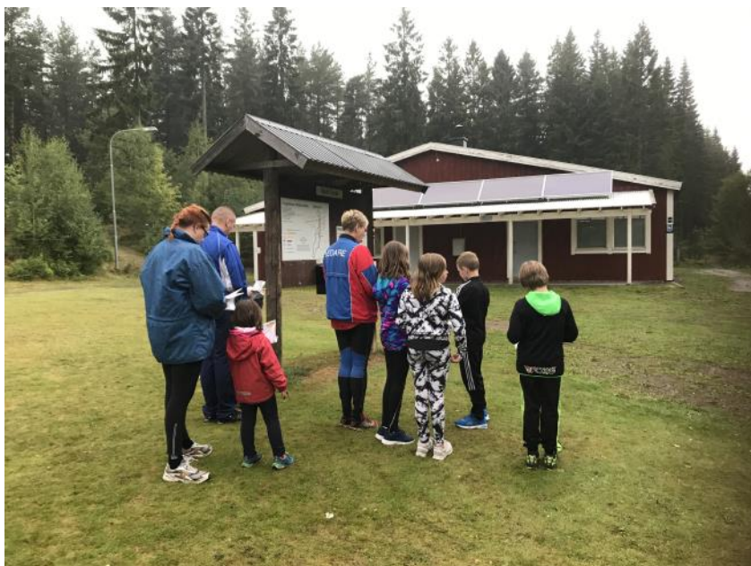
Många nya orienterare kom för att prova på sporten.