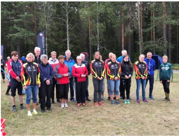
Skaraborgsmästarna i distansen lång samlade.